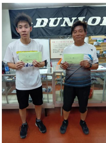
1位・2位リーグ 3位・4位