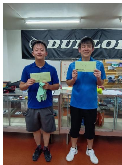
3位・4位リーグ 3位・4位