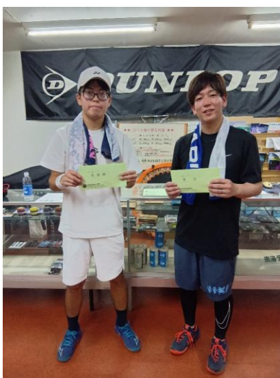
3位・4位リーグ 優勝・準優勝